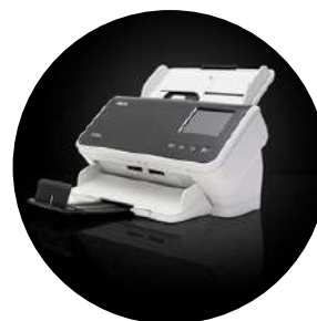
Escáneres Alaris S2060w/S2080w