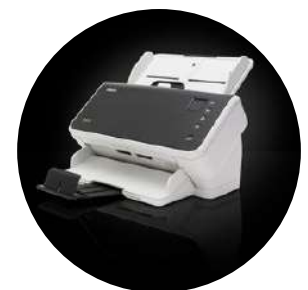
Escáneres Alaris S2050/S2070